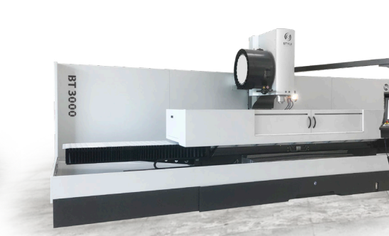
BT 3000 / BT 4000