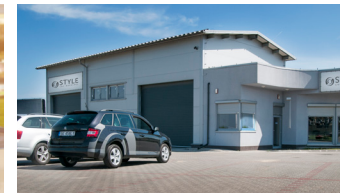
STYLE Polen (service & sales)