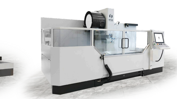
Semi plaatwerk (optioneel)