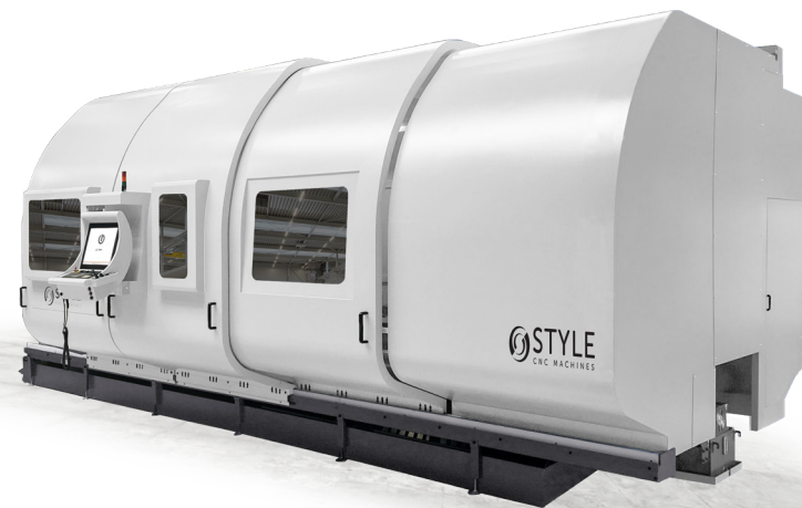
STYLE 1000 ~ 2200