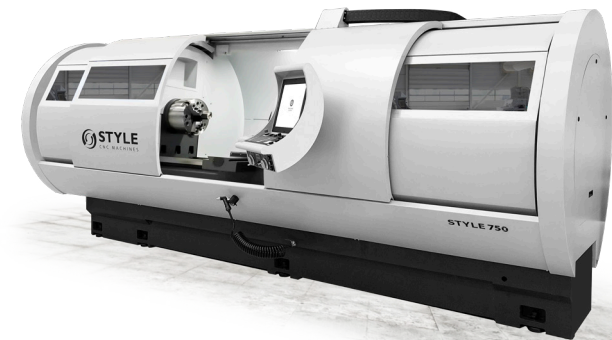
STYLE 650 / 750