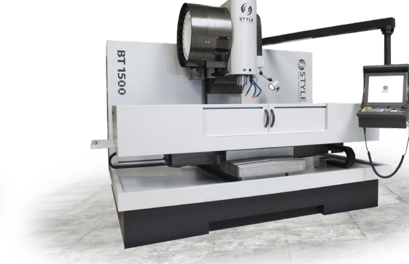
BT 1500 / BT 1500+