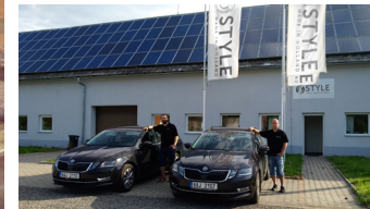
STYLE Tsjechië (service & sales)