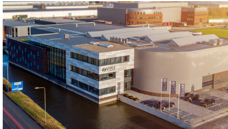
STYLE Nederland (assemblage, service & sales)

Bezoekadres Twee-Bruggenstraat 64/201 B-8530 Harelbeke