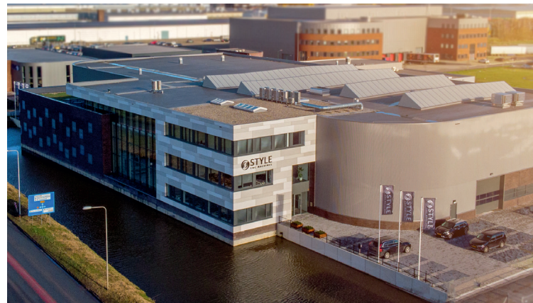
STYLE Nederland (assemblage, service & sales)

Afgifte goederen Het Steenland 25 3751 LA Bunschoten