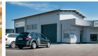
STYLE Polen (service & sales)