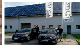
STYLE Tsjechië (service & sales)